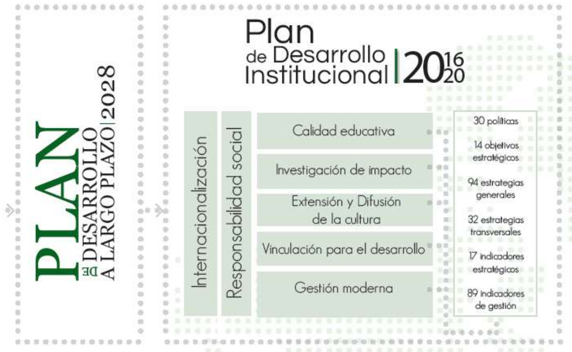
Figura 2. Articulación del Plan de Desarrollo Institucional 2016-2020

Para este efecto se consideran como ejes transversales la internacionalización y la responsabilidad social, de modo que por cada una de las funciones sustantivas se encuentra alguna acción que la atraviesa y por consiguiente un indicador puede reflejarlo.