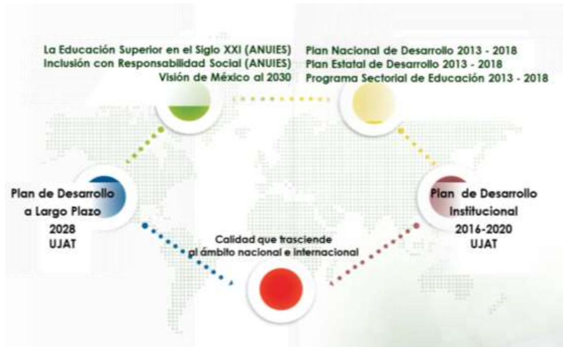
Figura 1. Contextos de la Planeación Internacional y Nacional en materia de Educación Superior

Ante esta realidad cambiante y dinámica, en búsqueda de que la planeación trascienda los periodos rectorales y sus tiempos, en 2015 la Universidad Juárez Autónoma de Tabasco diseñó su Plan de Desarrollo a Largo Plazo con una visión orientada al año 2028 y el Plan de Desarrollo Institucional 2016-2020 es el que se encuentra actualmente vigente (ver Figura1).