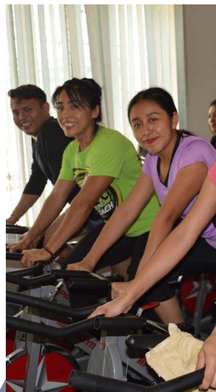
Espacios para realizar actividades deportivas.

La cultura física y deportiva es un elemento importante para desarrollar una salud adecuada, así como para fortalecer aspectos generales en la formación del estudiante. Por ello, se da especial énfasis a los talleres deportivos que se desarrollan en