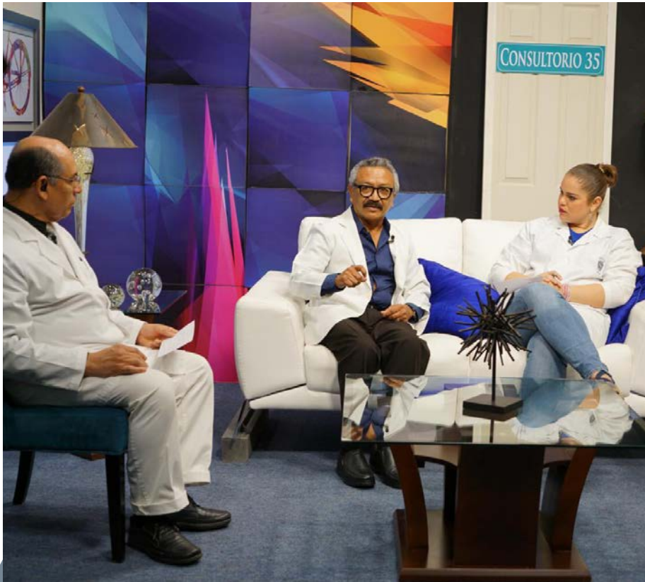
Programa de radio y televisión "Consultorio 35"