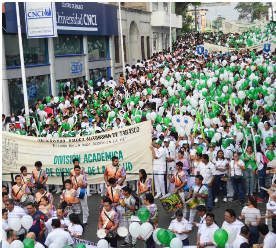
Asistencia de la DACS en el Tradicional Gallo Universitario 2017.

esta División, donde la entusiasta participación de los estudiantes da la pauta para continuar en la gestión de horarios alternos para su desarrollo.