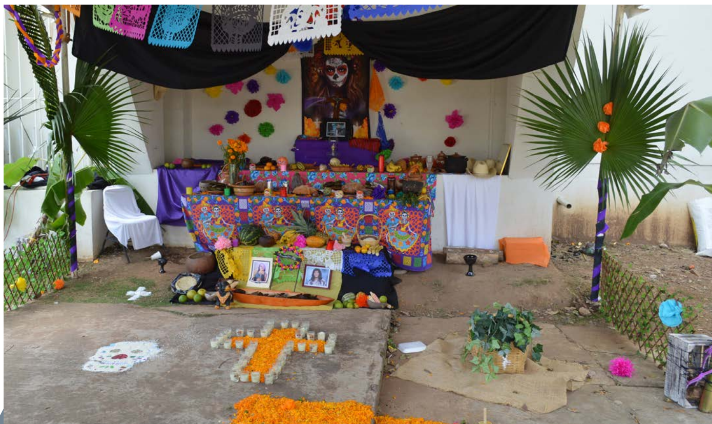
10 altares de muerto se presentaron en las festividades del día de muertos.