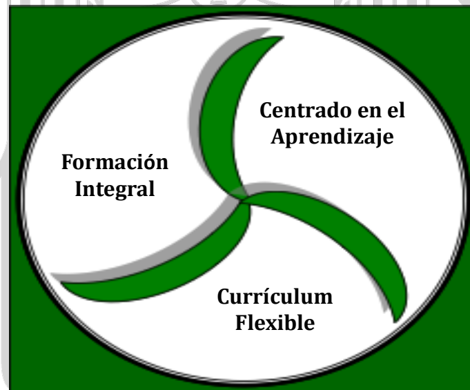
Figura 10. Modelo Educativo de la Universidad Juárez Autónoma de Tabasco

El modelo curricular del Doctorado en Educación se diseñó teniendo como referente inspirador el Modelo Educativo de la Universidad Juárez Autónoma de Tabasco el cual está caracterizado por tres ejes fundamentales: 1) formación integral del estudiante, 2) centrado en el aprendizaje y 3) currículum flexible (Ver Figura 10), enfatizando una formación holística incluyente que considera componentes primarios y secundarios que acompañan al doctorante durante su formación académica.